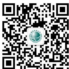
网上国网 95598 微信公众号