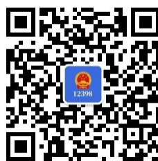
12398 能源监管 热线微信公众号